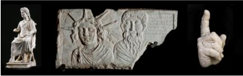
Vlnr: beeld van leraar/lerende christus, relief van Sol en Jupiter Dolichenus, rechterhand van één van de kolossale standbeelden van Constantijn.