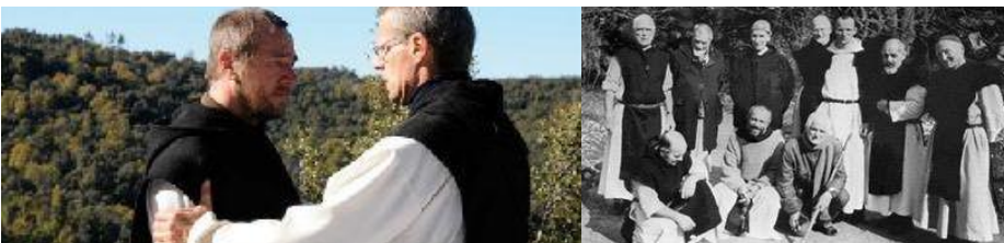
Links: de abt sterkt één van de monniken. Rechts: de Cisterziënzër gemeenschap die in 1996 werd ontvoerd en vermoord.

De kijker leeft met de monniken mee wanneer hun geloof door het kwaad op de proef wordt gesteld. Eerst is er begrip voor de motieven die monniken doen neigen naar een vertrek. Dit verandert later in respect voor de keuze die zij maken voor de navolging van Christus. Het kwaad en het lijden kunnen mensen, zo denk ik dan, naar een hoger niveau tillen en hen zo dicht bij God brengen. De monniken zoeken het martelaarschap niet op, maar ze gaan het uiteindelijk niet uit de weg. Ze kiezen voor hun ideaal van solidariteit met de inwoners van Tibhirine en van een spirituele dialoog tussen christendom en Islam. Deze dialoog vindt feitelijk plaats wanneer de abt een binnendringende terroristenleider een vers uit de Koran voorhoudt, dat door die leider wordt afgemaakt: “Onder hen die de islam het vriendelijkst bejegenen zijn mensen die zich christenen noemen; onder hen zijn priesters en monniken die nederig zijn.” De abt ontbindt aldus, volgens Otten, de agressie.