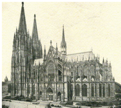
Vlnr: De Gasperi bij uitreiking van de Karelsprijs (1952), Madonna in de Rozenhaag (Lochner, rond 1450) en de Dom van Keulen

Ook in onze tijd is de band tussen kerk en Europa belangrijk. 65 jaar na de Schuman Verklaring herinnerde paus Franciscus onlangs aan de rol van de kerk in Europa in zijn Straatsburgse rede. Daarin verwees hij naar een anonieme auteur uit de 2e eeuw die schreef dat christenen voor de wereld moeten zijn wat de ziel voor het lichaam is. De rol van de ziel is de ondersteuning van het lichaam, het is het bewustzijn en de herinnering. De paus riep dan ook Europa op om haar ware gezicht te hervinden om te kunnen groeien in vrede en harmonie, zoals haar stichters dat wilden. Hij riep het Europese Parlement op om samen met de kerk aan een Europa te werken dat niet om economie draait, maar om de heiligheid van de menselijke persoon, om onvervreembare waarden.