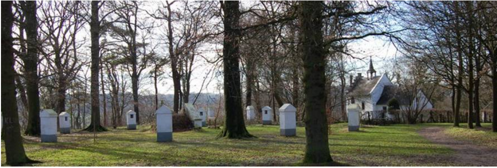
Boven: de kruisweg bij de kapel. Onder: de kapel van de kluis (1688) met kluizenaars. Foto's en informatie: http://www.dekluisvalkenburg.nl